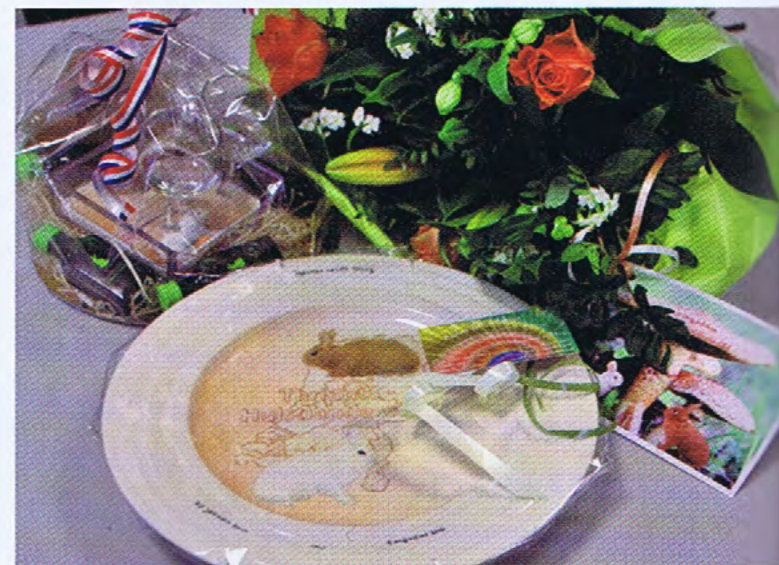
Een fraai beschilderd wandbord, oranje/witte bloemen en een borrel. Zo kun je weer thuiskomen.