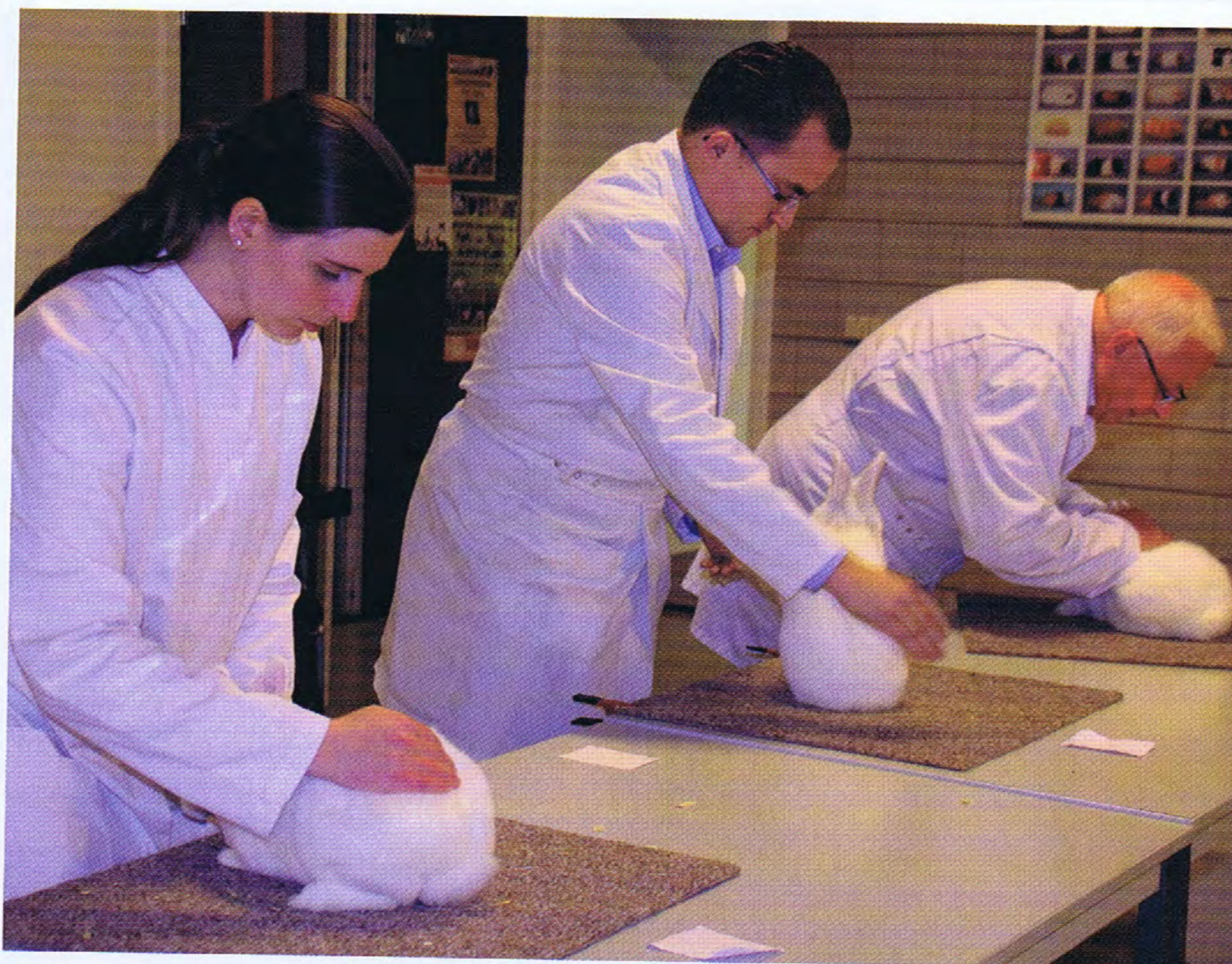
De eindkeuring van de Hulstlanders.

Maar iedere club heeft z'n eigen vraagprogramma, doet z'n eigen (eind)keuring en heeft z'n eigen prijzenschema. Iedere club houdt dus zijn eigen identiteit. Maar de mooiste van de dag is dan weer een gezamenlijke actie. Toch een beetje