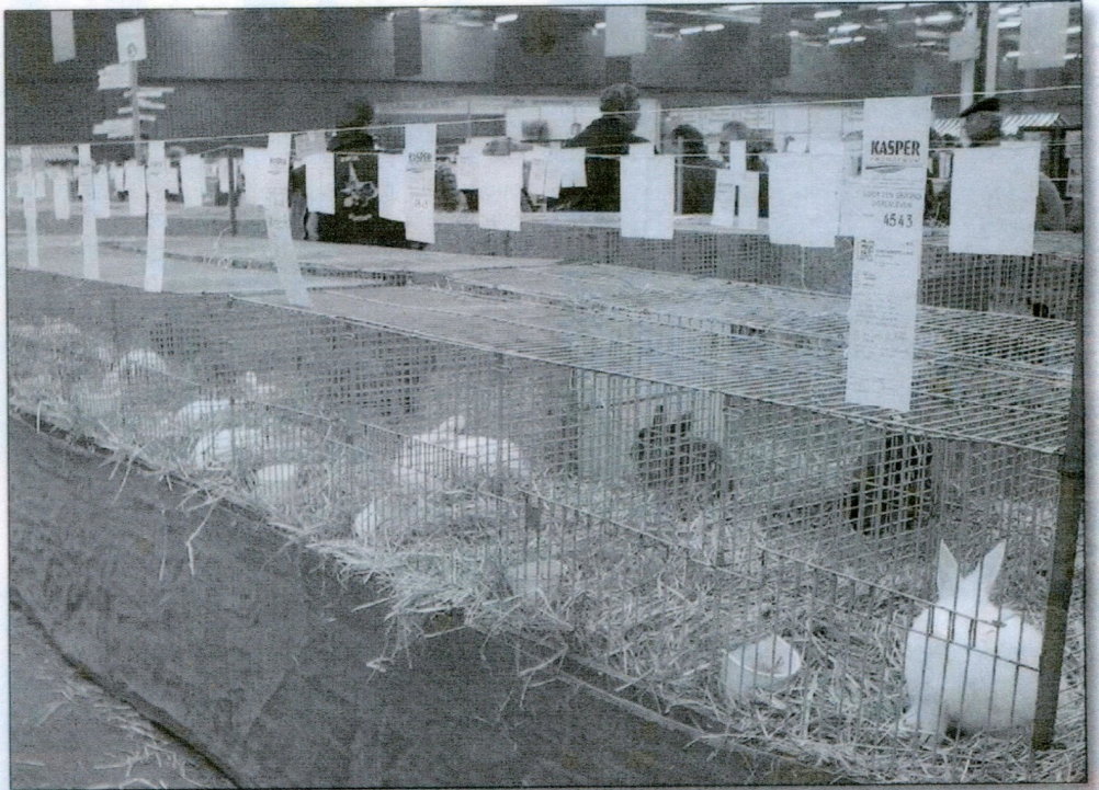
Overzichtsfoto van de Hulstlanders op de KleindierenExpo 2005.